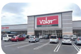
スーパーマーケットパロー 約 1200m / 車で約 4 分