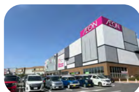
イオンモール各務原 約 6700m / 車で約 15 分