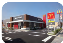
マクドナルド 約 850m / 車で約 3 分