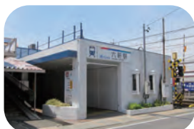
名鉄各務原線 六軒駅 約 2100m / 徒歩約 28 分