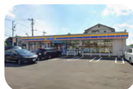
ミニストップ 約 770m / 徒歩約 10 分