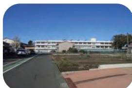
蘇原第一小学校 約 400m / 徒歩約 5 分