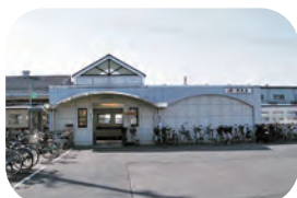
JR 高山本線 蘇原駅 約 2200m / 徒歩約 28 分