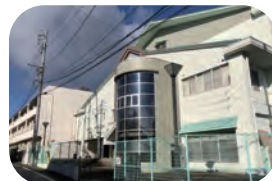
蘇原中学校 約 1300m / 徒歩約 18 分