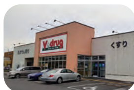
V・drug 約 900m / 車で約 3 分