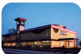
美人の湯かがみがはら 約 1600m / 車で約 6 分