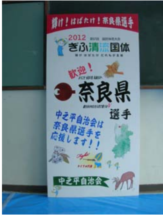
町内65自治会が作製する「都道府県応援ボード」

開催地の白川町では、町内65の自治会による応援ボードの作製や、今年で4年目を迎える国体花飾り事業、また町内保育園・小中学校では手作り応援のぼり旗の作製、プラ