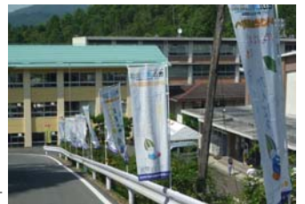
町内保育園、小中学生が作製する「手作りのぼり旗」