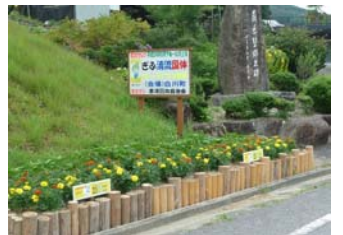
4年目を迎えた「国体花飾り事業」