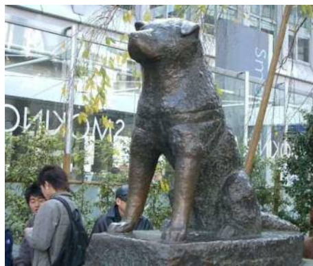
b y 安江