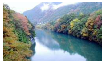
b y 柘植（保）

いびがわマラソンのエントリー料はフル5000円、ハーフ4500円とお値打ちです。大会当日にはウォーキングや物産展等、応援に来た人も同伴者も楽しめるイベントが用意されています。ぜひこの雰囲気一度、肌で感じに足を運ばれたらいかがでしょうか。